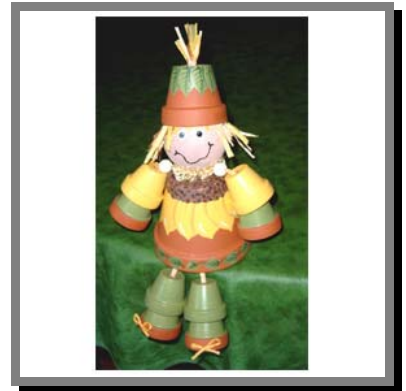
V03) Miss Girasole con vasetti di terracotta dipinti