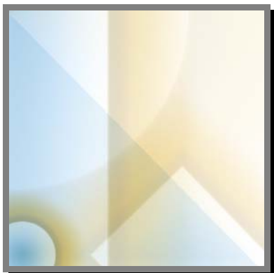
V07) Campanelle (con ristorante per uccellini) in vasi di terracotta decorati