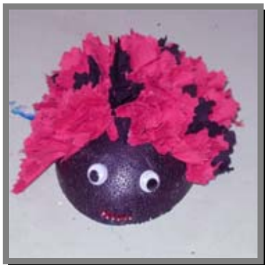
B11) Coccinella porta fortuna con ciuffetti di stoffa rossa e nera