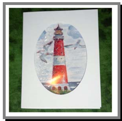
B18) Biglietti in rilievo, a pioggia e con i brillantini per diverse occasioni