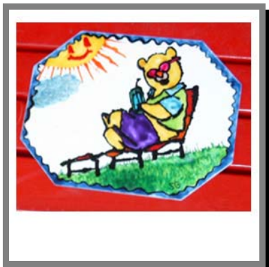
B10) Tappetino per il mouse decorato con window- colors