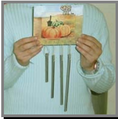
M02) Campanella del vento con base in legno e melodiosi cilindri d'alluminio