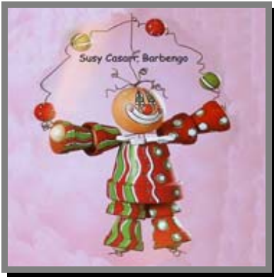
M01) Omino di vasi di terracotta decorato con appositi pennarelli