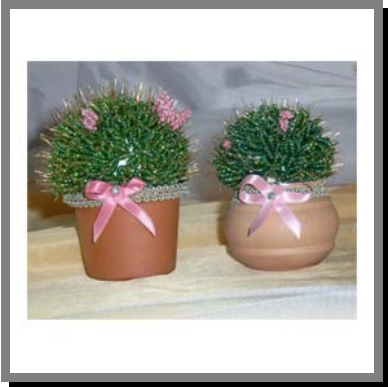
M13) Cactus spinoso in filo d'ottone e perline di conterria