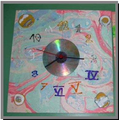
R04) Orologio da parete decorato con colori marmorizzati