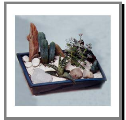
R18) Piccolo giardino con piante vere, per decorare la scrivania o la tavola