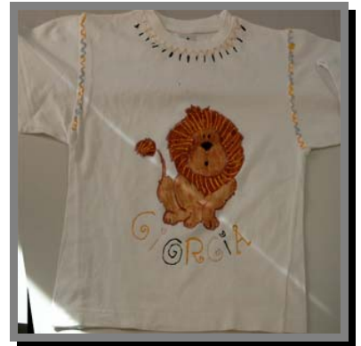
R03) Decorazione su stoffa con i colori che si gonfiano Pic-Tixx