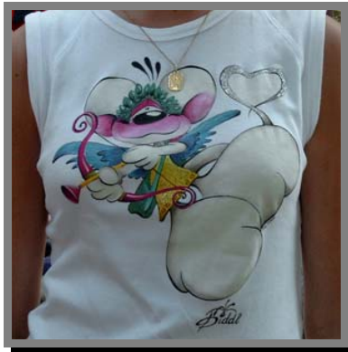
R02) Decorazione su stoffa con gli speciali colori Fashion- Pen