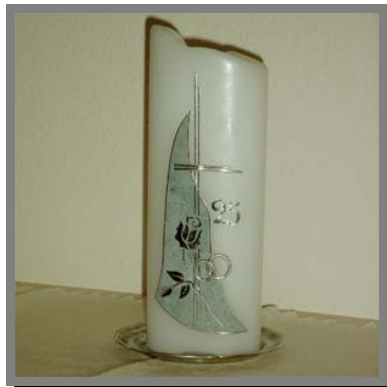
R17) Candele decorate con fogli, cordoncini e speciali pennarelli di cera