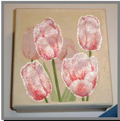
R05) Scatola porta CD decorata la tecnica del découpage col tovagliolo