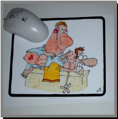
R01) Tappetino per il mouse decorato con window- colors