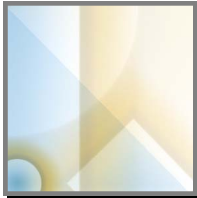
R11) Portachiavi "bestiale" con semplice filo di ferro e perline