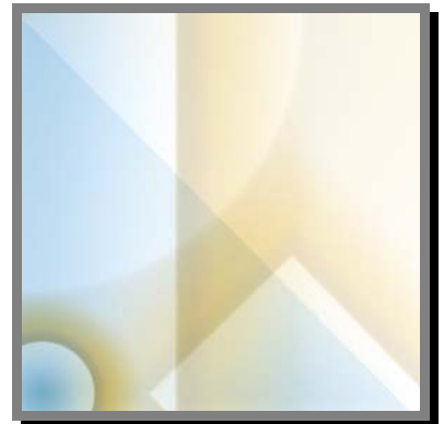
R06) Trasformiamo un semplice pezzo di stoffa in un oggetto utile e decorativo