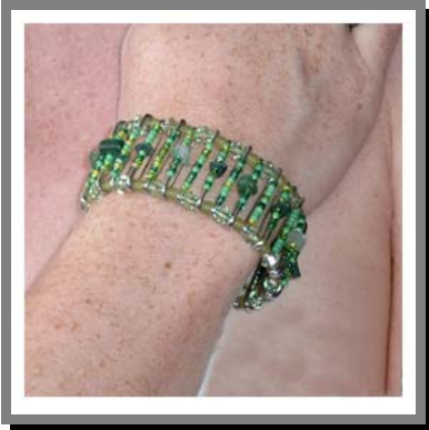
R22) Collana o bracciale composto da spille di sicurezza