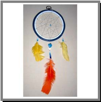
R10) Costruiamo un autentico acchiappasogni indiano che funziona veramente