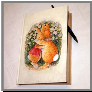
R14) Quaderno decorato con la tecnica del découpage col tovagliolo